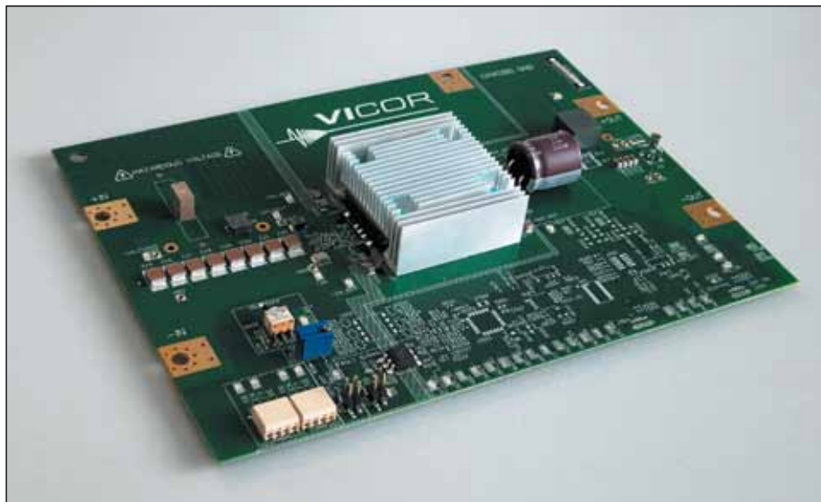
Рис. 3. Оценочная плата для модуля семейства VI Chip DCM

температурном диапазоне нужно уже на самых ранних стадиях проектирования думать о конструкции системы охлаждения модуля.